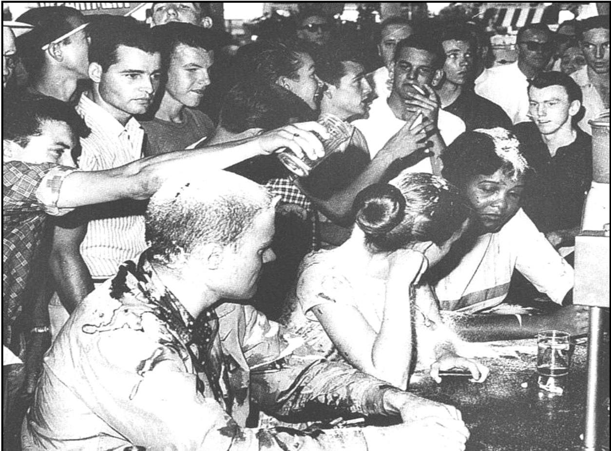
[Uit Parting the Waters: America in the King Years 1954–63 deur T Branch]

Die bron hieronder is 'n foto uit 'n boek met die titel Parting the Waters: America in the King Years 1954–63 deur T Branch. Dit toon drie studente wat op 28 Mei 1963 aan 'n sitstaking by 'n middagete-toonbank in Jackson, Mississippi, deelneem. 'n Lid van die wit groep gooi 'n vloeistof oor 'n sittende student uit.